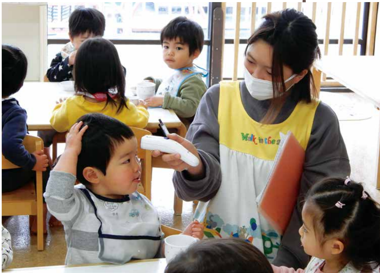
明和第一保育園 保育士